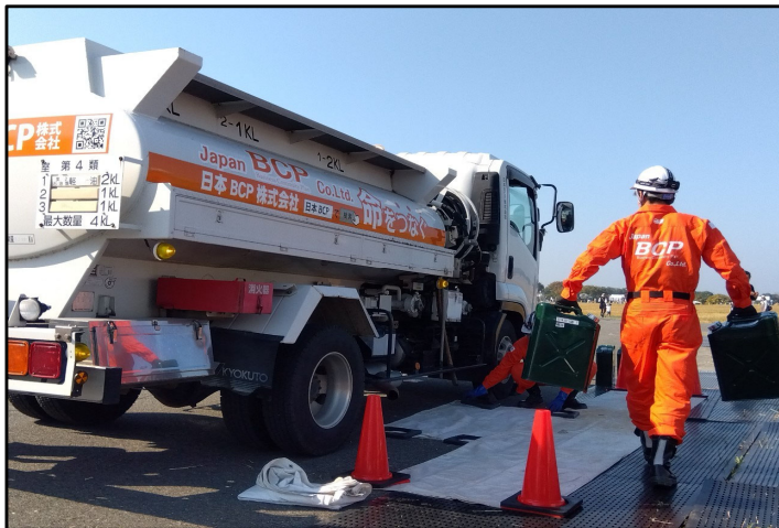
災害時における移動基地局への燃料供給 2023年11月3日（金）

10年以内に30%、30年以内に70～80%の確率で発生するといわれている南海トラフ巨大地震への防災意識が高まるなか、堺市堺区匠町「海とのふれあい広場」にて、国土交通省近畿地方整備局と堺市が主催する合同総合防災訓練へ参加しました。