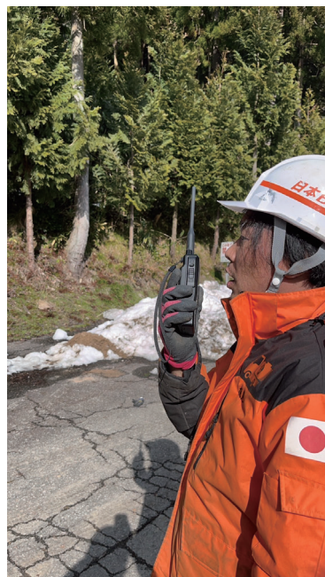
MCA無線で連絡を取り合う様子