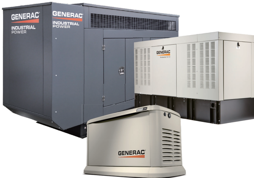
補助金対象ガス発電機：令和 7 年度にて厚生労働省補助金申請終了

お客様から大規模災害による長期停電対策として、補助金を活用した自家用発電機の導入のお問い合わせを多数いただいています。(ガス・ディーゼル対応可)